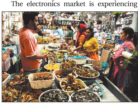
People are gearing up to celebrate the five day Festival of Light in the city and markets were abuzz with shoppers on the eve of Diwali.

the maximum rush, with buyers seeking lights to adorn their homes. Preferences vary, with some opting for star lights, while others favor lamp lights, which remain in trend every year. A considerable number of people are also investing in smart lights for home decoration, operable through mobile devices, offering a unique touch to festive decor.